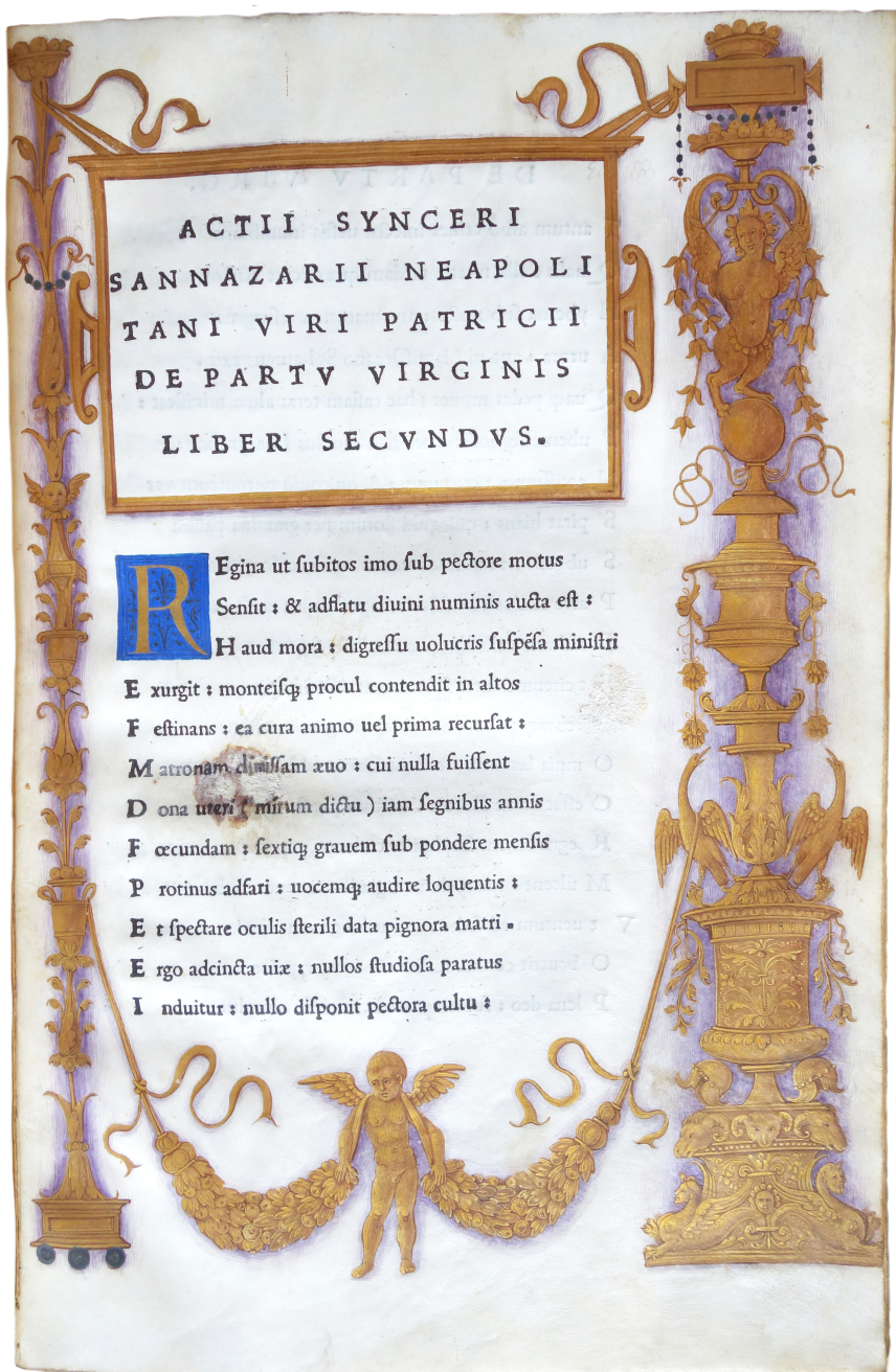
3. Jacopo Sannazaro, De Partu Virginis, Napoli, Antonio Frezza da Corinaldo, 1526. Ignoto miniatore napoletano, Incipit del secondo libro, Parigi, BnF, Réserve des livres rares, Vélins 567, c. C4r.