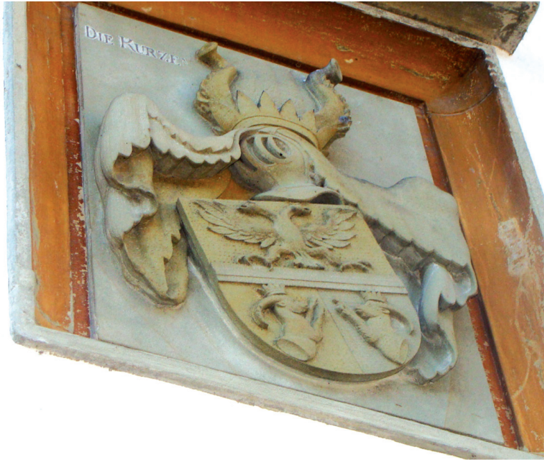
Ill. 1. Armoiries des Kurtz au-dessus de la porte d'entrée du château de Senftenau (Lindau, Lac de Constance)