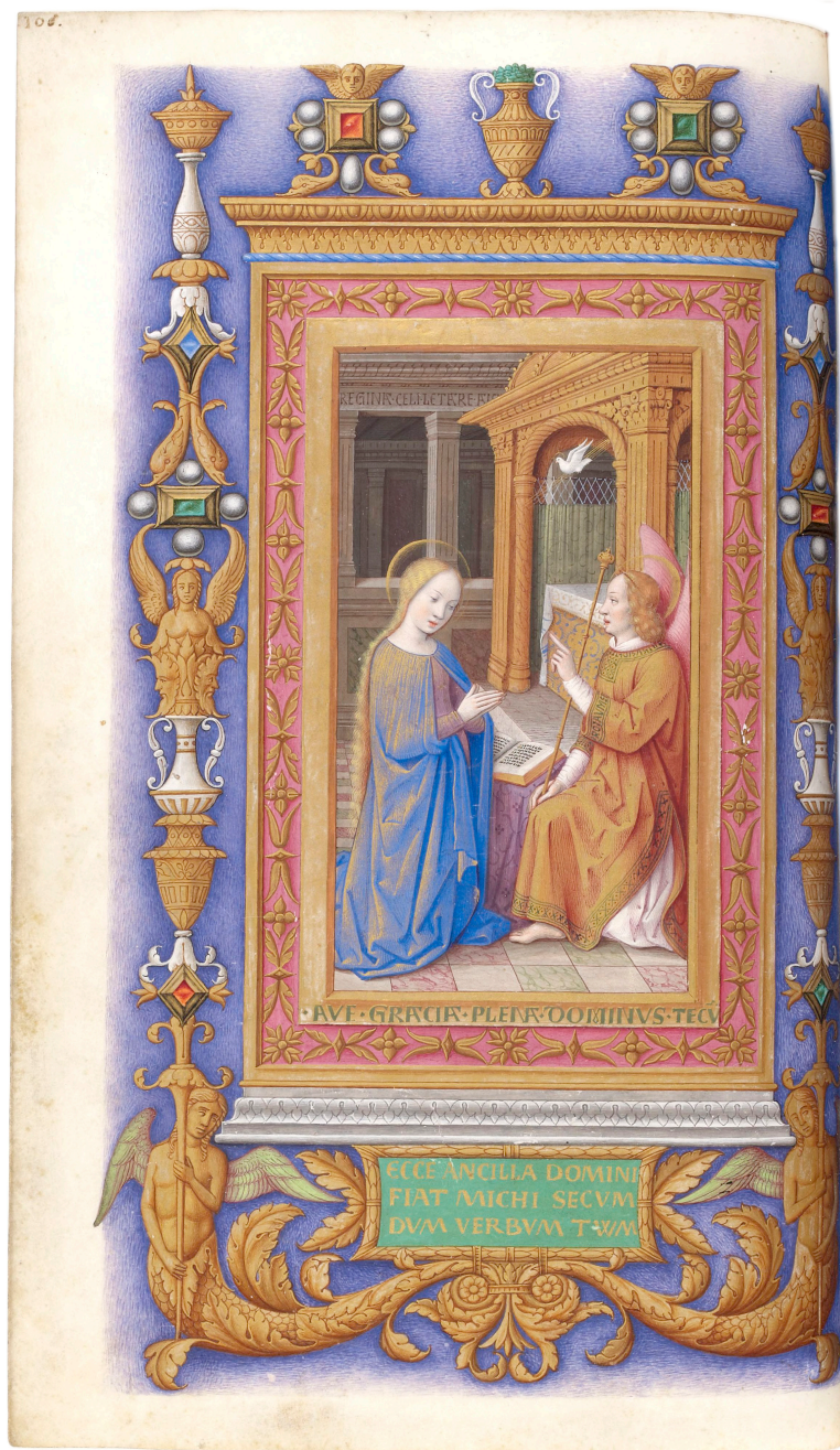
6. Libro d'ore di Federico d'Aragona . Jean Bourdichon, Annunciazione ; Ioan Todeschino, fregi e cornice, Tours, 1502 ca., Parigi, BnF, Département des manuscrits, Latin 10532, f. 106.